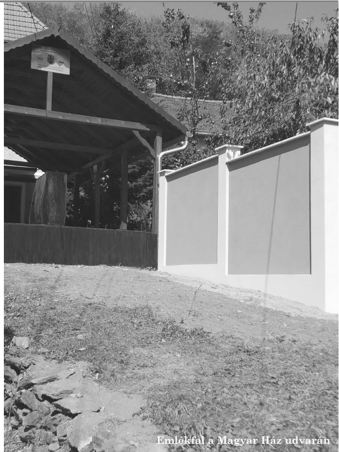
Emlékfal a Magyar Ház udvarán

11:15 Laying of commemorative wreaths at the Bust of Báthory István. Place: the garden of the Roman Catholic Church. Nr. participants: Maximum 50. Registration: on the Facebook page of the event.